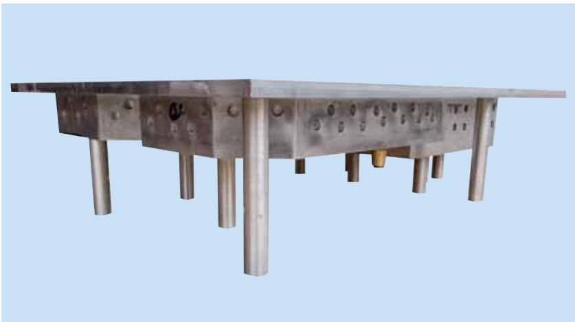
Suurimman työstökeskuksemme x-liike on 1850mm, jolla onnistuu isompientkin kokonaisuuksien valmistus.

Käytössämme on Surfcam 3D ohjelma, jonka avulla koneistajamme pystyvät laatimaan vaatimattomimmatkin työstöradat. Lisäksi käytämme Surfcam 3D:n yhteydessä Part Modeler-ohjelmaa, joka mahdollistaa useiden eri tiedostoformaattien käsittelyn vaivatta.